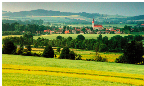
Kraj Českého Meránu s dominantou kostela sv. Vavřince v Prčici