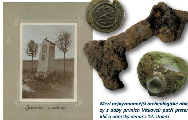
Mezi nejvýznamnější archeologické nálezy z doby prvních Vítkovců patří prsten, klíč a uherský denár z 12. století