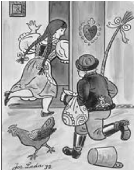
Velikonoční pomlázka na obrázku Josefa Lady