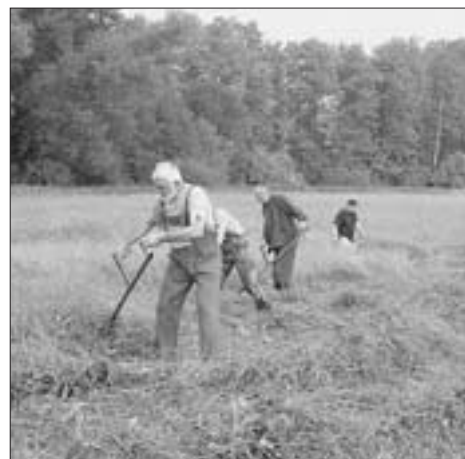
Naše poděkování patří všem těm bezejmenným, kteří dlouhé týdny předem připravují kolbiště, shání soutěžící, zajišťují rekvizity.

Jisté úpravy se budou týkat také večerního finále. Kupříkladu už nevidíte pivní štafety mužů a štafetu žen, o zážitek ale nepřijdete. Pivní štafeta bude jen jedna, obsazená více startujícími, do které se zapojí jak muži, tak i jedna žena. Dohodli jsme se také, že odložíme tradiční stopky a pivní štafetu si ohlí-