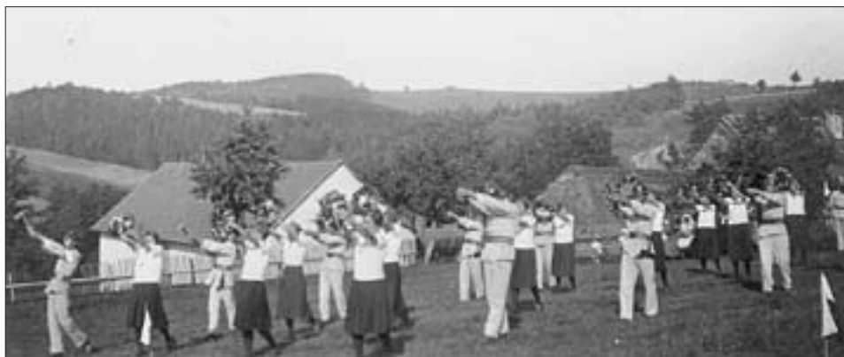
Společně cvičení hasičů Vrhotice, Den brannosti Mezno, rok 1937