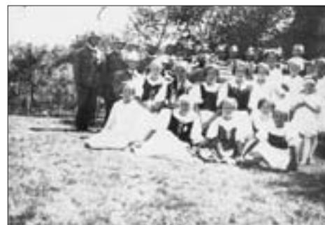
Dvorce – svěcení stříkačky 27. 6. 1937