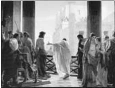
Ecce Homo (Ejhle člověk), malíř: Antonio Ciseri, 19. století

Datum Velikonoc se tedy může lišit mezi jednotlivými roky o více než jeden měsíc (od 22. března do 25. dubna). V našich zeměpisných šířkách to ovšem znamená i to, že jednou slavíme Velikonoc zalité sluncem, uprostřed rašícího jara a jindy koledníci běhají za pomlázkou zachumláni v zimních