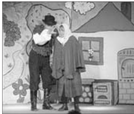
Fotografie z pohádky Sekerková polévka .