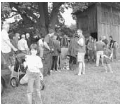
Přestavlká střelnice ožívá každoročně při Derby

V rámci výroční schůze řešili členové sdružení otázku podpory loveckých psů, příspěvky na jejich chov, hospodaření sdružení za rok 2010 a finanční plán pro rok 2011. Určitě stojí za zmínku, že pod-