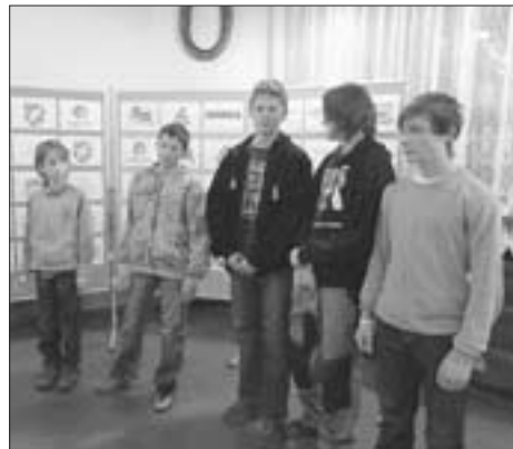
Mladí atleti, kteří vzorně reprezentovali město.

Další akcí, kterou oddíl ASPV pořádá, je Běh naděje – běh proti rakovině. Loni se konal již 12. ročník a zásadní změnu doznal jak termín, tak i trasa běhu. Sportovci opět spojili síly s Městem Sedlec-Prčice a připravili pro děti i dospělé sportovní-zábavní program. 12. ročníku se účastnilo 180 přispívajících a na konto Běhu naděje bylo odesláno 10 300,- Kč.