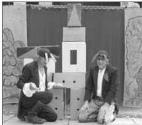
Fotografie z pohádky O dvou chroustech .