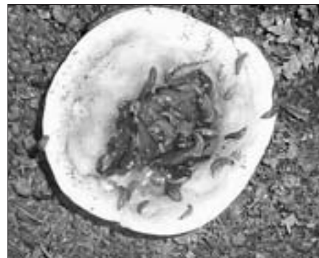
Slimáci jdou pryč na pivo