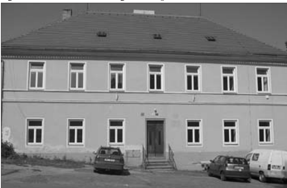
Budova bývalé přčické školy už zase slouží svým původním účelům. Od ledna 2011 se v ní opět učí.