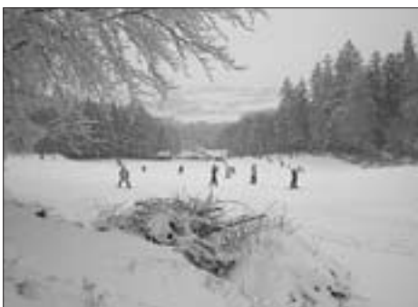
Zima přála zimním sportům, i Ski Kvasejovice běželo na plné obrátky.

Nový rok 2010 začal opravdu zimmně. Zatímco Vánoce byly ještě na blátě a na silvestra dokonce padla mlha jako mlíko, krátce po Novém roce se ohlásila paní zima se vším všudy. Najednou jí bylo všude dost. Vzpomínáte? Loňská zima byla hodnocena jako jedna z nejurputnějších v posledních letech a silničáři i služby měli až do března o práci postaráno. Také koledníci při tříkrálové sbírce se přesvědčili, jak náladové umí lednové počasí být,