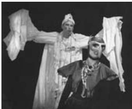
Foto z pohádky Strašidýlko z Metwillu

Nezapomínáme však ani na děti. V neděli 27. října 2011 od 15 hodin jim přijede divadlo Antonína Dvořáka Příbram zahrát nádhernou velkou pohádku „Strašidýlko z Metwillu“.