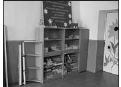
Za pár dnů se třídy opět naplní dětmi.

„Jsem opravdu moc rádi, že se do Přčice vracíme, právě dnes jsem se byla ve škole podívat, děti uspořádaly na uvítanou takovou malou vánoční besídku a je na nich vidět, že se už do staronové školy moc těší. V Přčici budou mít nejen prostorné třídy, bude zde i relaxační místnost a také dostatek místa pro kroužky. Pravděpodobně sem přestěhu-