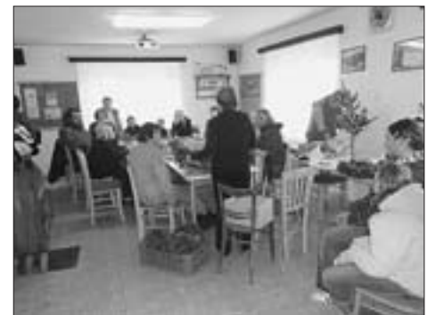
Vánoční zdobení v obecním domě v Měšetících.