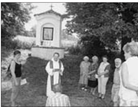
5. července byla znovu vysvěcena zrekonstruovaná trojboká kaplička u Přestavky