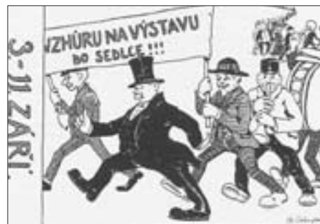
Dobová propagační pohlednice vydaná před výstavou

V osmi dnech výstavy byl opravdu bohatý program. V neděli 3. 9. bylo slavnostní zahájení. Pondělí, úterý a středa byly vyhrazeny k prohlídkám jednotlivých exponátů. Ve čtvrtek už začaly pracovat odborné poroty na hodnocení vystavovaných exponátů a také se konal sjezd rodáků a přátel sedleckého okresu. V pátek byl sokolský den a pokračoval sjezd rodáků. V sobotu byl sjezd rolníků a živnostníků, v neděli sjezd sborů dobrovolných hasičů a zároveň okresní výstava koní. V pondělí 11. 9. bylo oficiální ukončení výstavy s jejím hodnocením, které bylo veskrze kladné.