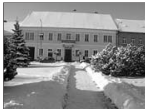
V půli prosince bylo město sněhem doslova zaplaveno, Vánoce budou bílé!

Na Moninci i ve ski areálu Kvasejovice se rozběhla další lyžařská sezóna a do stop vyrazili i první natěšení běžkaři. Ve středu 15. prosince proběhlo poslední zasedání zastupitelstva města v roce 2010, ten den opět hustě sněžilo a teploty klesly hodně nízkou pod nulu, proto byl zájem veřejnosti jen minimální.