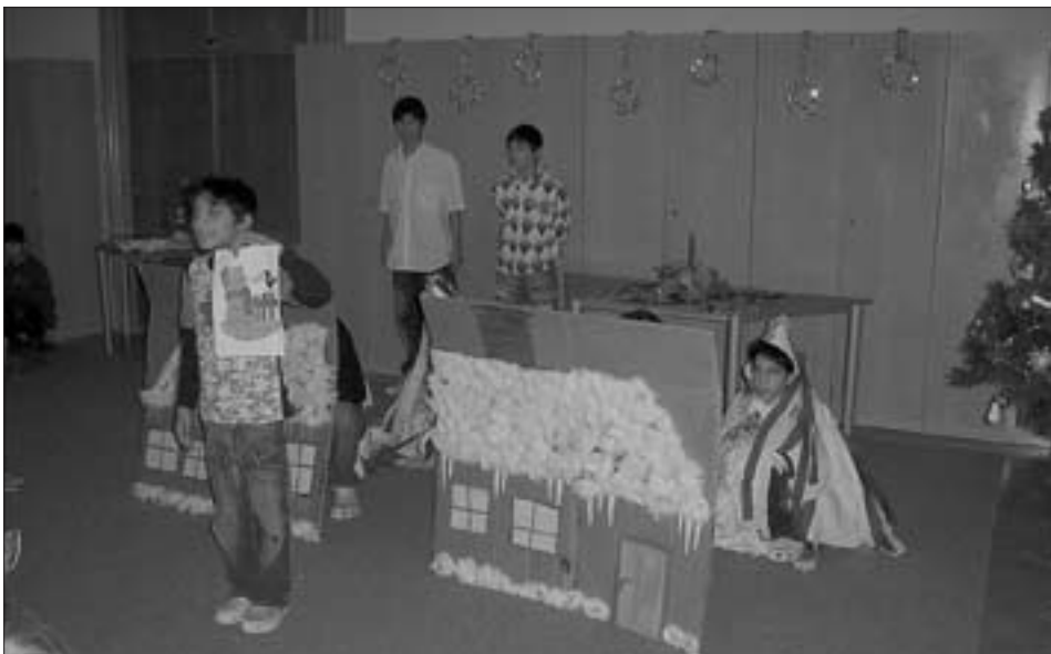
Vánoční besídka si v dětském domově užili všichni, děti i dospělí.