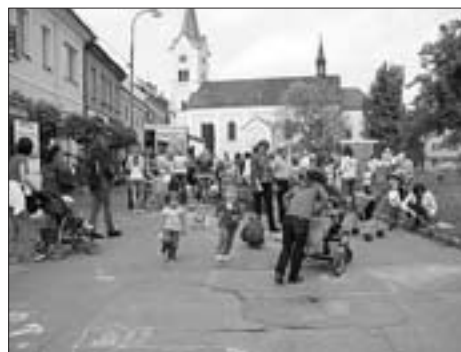
Na konci května se konal Běh naděje proti rakovině spojený s dětským odpolednem

Konečně nastalo jaro, po dlouhé zimě vše raší a teplé počasí láká do přírody. Klub přátel dlouhých kilometrů uspořádal jubilejní 40. ročník pochodu