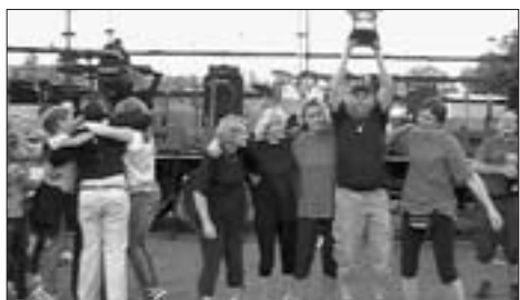
11. ročníky Derby vyhrál Sedlec

A najednou tu byl konec června a s ním i další ročník derby. Počasí i tentokrát přálo a program