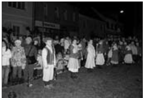
Advent jsme opět přivítali společně

19. listopadu Česká televize odvysílala další díl úspěšného televizního seriálu „Vyprávěj“, ve kterém se hlavní protagonisté vydali na pochod Praha – Prčice. Kdo se však těšil na záběry z našeho města, byl hořce zklamán. Z Prčice se v seriálu objevil jen krátký historický černobílý šot z jednoho ročníku pochodu, který tvůrci vyhrabali kdesi v televizním archivu. Za místo cíle, tedy Vítkovo náměstí s kostelem sv. Vavřince, kašnou, nemocnicí i typickou prčickou radnicí, autoři seriálu vydávali jakési podivné místo s oprýskaným stavením za drátěným plotem. A to už ani nemluvíme o faktu, že hrdinové seriálu tvrdošjně používali výraz „do Prčic“ a „v Prčících“, neboť scénárista se ani