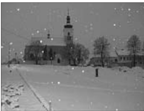
Začátkem prosince se protrhla bílá pěšina

neunavoval zjišťovat, jak se naše město správně jmenuje. Prostě hanba, ubohost, lacinost.