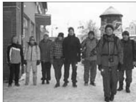
Členové Klubu přátel dlouhých kilometrů vyráží na poslední společný výšlap v roce 2010