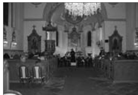
V kostele sv. Jeronýma se konal koncert v rámci hudebního festivalu Podblanický hudební podzim