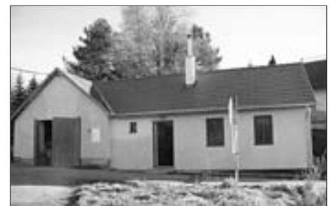
Čtětícti hasiči se svépomocí pustili do stavby klubovny u své hasičárny

Mezitím se ve škole rozjely práce na rekonstrukci divadelního sálu. Oslavili jsme 65 let od ukončení druhé světové války, vyšel nový vlasti-